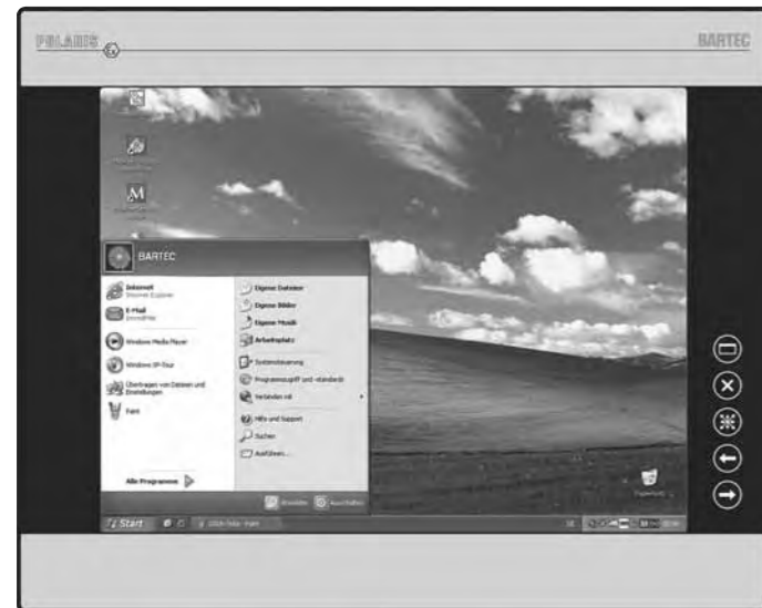
POLARIS Remote 15' with keyboard and mouse "北极星" 15寸远程站