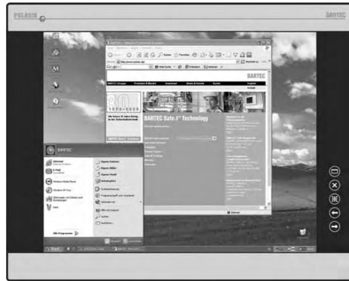
POLARIS Remote 19.1' with keyboard and mouse "北极星" 19.1寸远程站